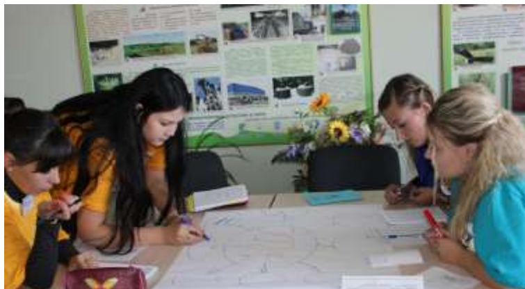
Слет молодых педагогов

Опыт разработки и реализации эффективных образовательных решений по многим из указанных направлений востребован не только в Тамбовской области, но и за ее пределами. На это указывает интерес, проявляемый к открытым мероприятиям межрегионального характера, организуемым Тамбовским ИПКРО. Например, участниками