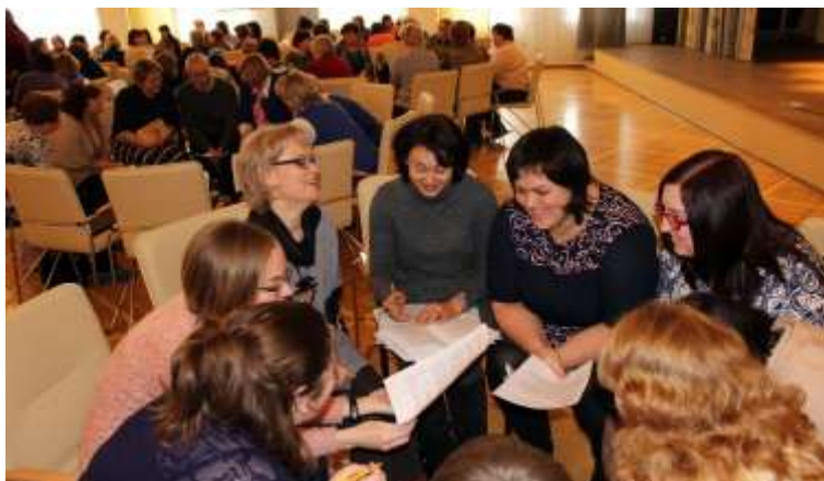
Работа школьных команд

тельных систем; общеобразовательных дисциплин), 5 отделов (начального и среднего профессионального образования; экспериментальной работы и инновационной деятельности; учебной работы; информационно-технологического и редакционно-издательского); 2 Центров и нескольких лабораторий. Система лабораторий, создаваемых с целью научно-методического сопровождения наиболее актуальных процессов региональной системы образования, носит гибкий характер и с течением времени претерпевает изменения. В настоящее время, с учетом приоритетных задач, решаемых Институтом, действуют лаборатории информатизации управленческой деятельности, развития профессиональных компетенций и взаимодействия с муниципальными методическими службами, сохранения и укрепления здоровья обучающихся, духовно-нравственного просвещения и воспитания, инклюзивного образования детей с ОВЗ, а также лаборатория приоритетного национального проекта «Образование».