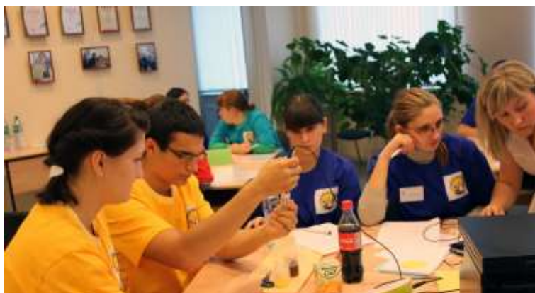
Учимся проведению исследования с помощью цифровой лаборатории