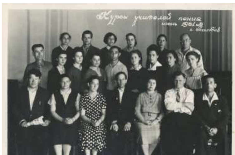
Курсы повышения квалификации учителей пения. Июнь 1961 г

После войны Тамбовский институт усовершенствования учителей открывает новую страницу своей истории: расширяются его площади, увеличивается количество кабинетов, появляются новые направления и формы работы.