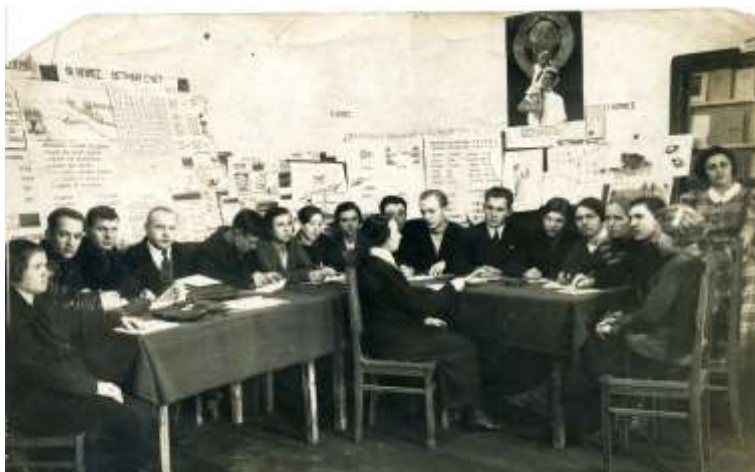
Первый выпуск ИУУ 1938г. (На курсах инспекторов рай(гор)оно)