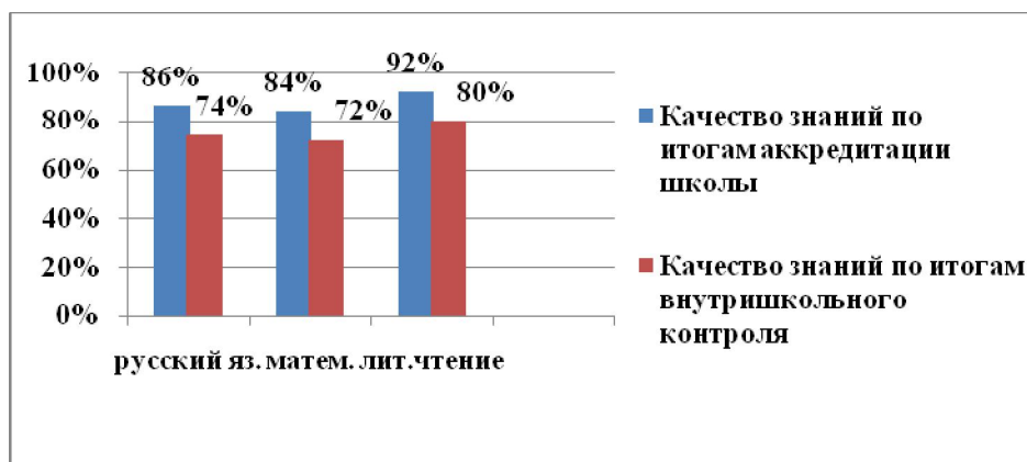
Диаграмма качества знаний по итогам аккредитации образовательного учреждения и по итогам внутришкольного контроля

Предлагаемые образцы не являются эталонами. Учитель может представлять информацию в любой форме, главное, чтобы материал был представлен доказательно и отражал показатели, по которым эксперт будет оценивать конкурсанта.